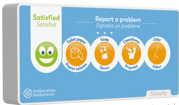
Exemple de façade personnalisée (Vinci Airports)