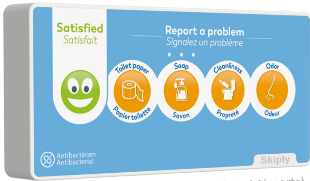
Exemple de façade personnalisée (Vinci Airports)